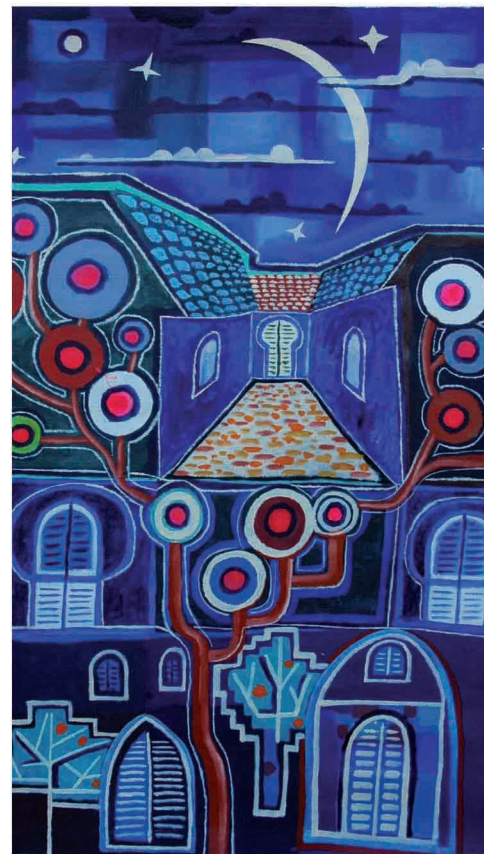
"Pavana bajo la luna menguante". Acrílico sobre tela. 120 cm x 80 cm.