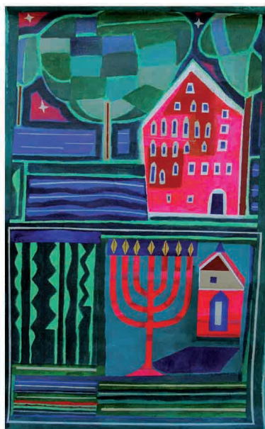
"A la sombra de un pinar". Acrílico sobre tela. 120 x 80 cm.

Frente al paradigma en estos tiempos de ética light, pintar es hoja de ruta, medicina nectárea paliativa. Si el mundo puede perder su inquietud metafísica, el artista no.