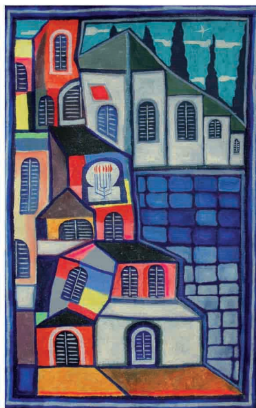
"Paisaje". Acrílico sobre tela. 120 x 80 cm.

...ahora que mis pies se encuentran enterrados en la caliente arena del desierto, cierro los ojos. No necesito ver más. Mi deseo es sentir el débil paso del aire fresco entre las finas hojas de las palmeras.