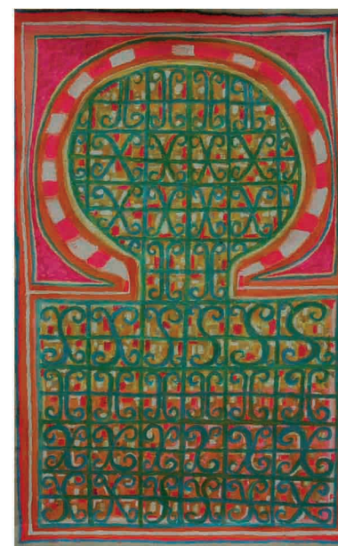
"Puerta". Acrílico sobre tela. 120 cm x 80 cm.

¿Acaso no es en definitiva la sed de vida la que impulsa al ser, en su pleno conocimiento y dimensionamiento, hacia la trascendencia? ¿Quién es artista ajeno a tal categoría?: Nadie, pues en conclusión, el más importante, el grave y urgente problema de la vida y la ausencia de esta, es la insoportable levedad del ser, la muerte, la cual pesa aún más precisamente en estos momentos de áridas e infértiles interioridades. Y así, en yuxtaposición, la vida, al menos la del artista, la de este artista, es un proyecto de construcción de un camino de plenitud hacia el infinito.