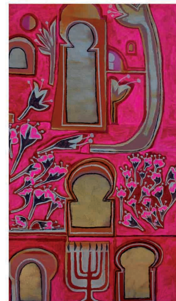
"Atardece". Acrílico sobre tela. 120 cm x 80 cm.

Fragmentos del Poemario Extraño. Rafael Romero, 1997.